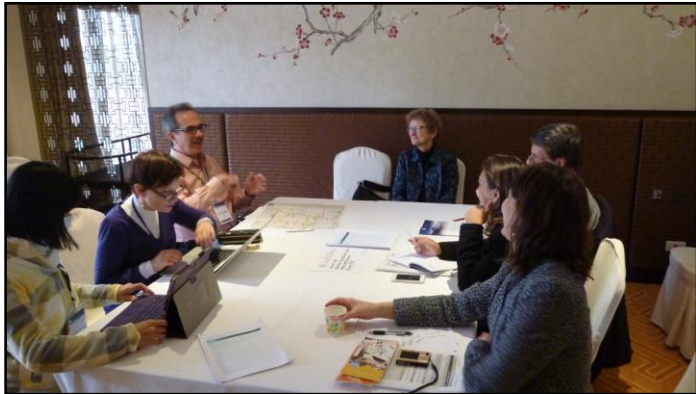
Topic: Palliative Care and End of Life