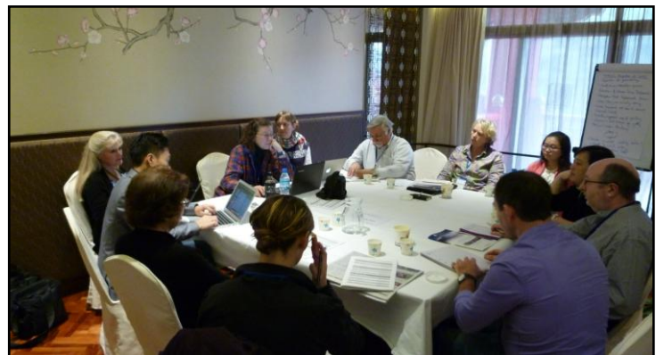
Topic: Sociology of Death and Bereavement - Social Justice