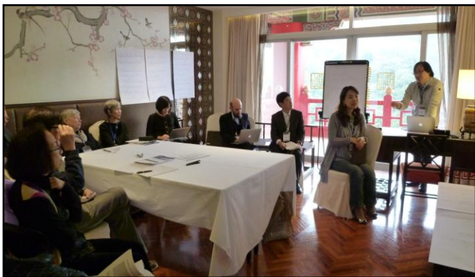
Topic: East Asia and Approaches to End of Life Care and Discussion