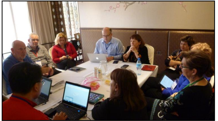
Topic: Community Literacy and Social Media with Regard to Death, Dying and Bereavement