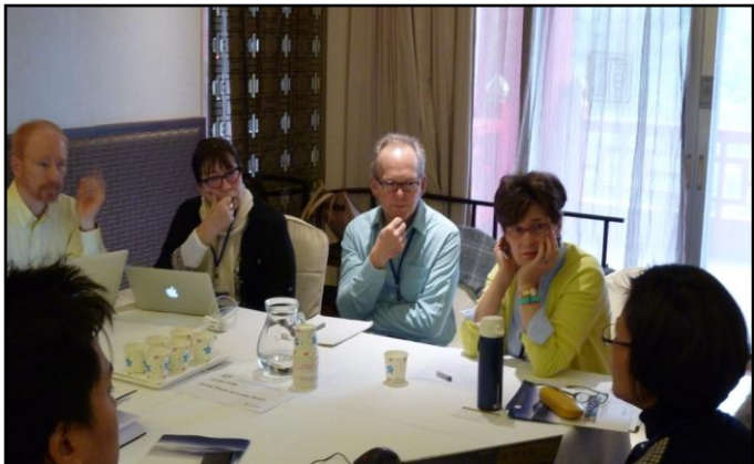
Topic: Psychotherapy of Complicated Berea